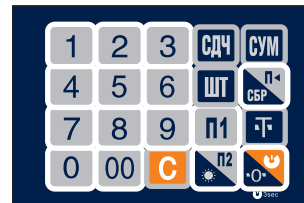
Рис. 3. Клавиатура